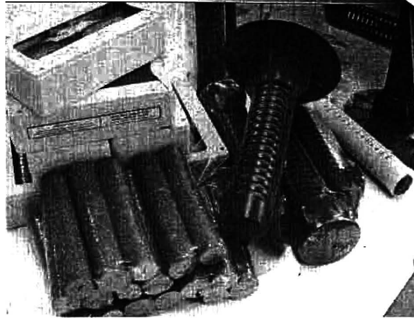
ผลิตภัณฑ์ 3 รูปแบบ

ปลวกเพื่อล่อให้ปลวกมากัดกินเหยื่อสมุนไพรที่อยู่ในกล่อง Terminus การตรวจเช็คเช่นเดียวกับ Terminate จะสามารถสังเกตได้