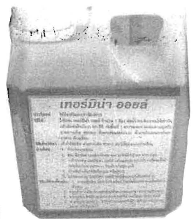
แบบเทอร์มินาออยล์

ต้นพริก มีผลต่อการลดการทำงานของอนุมูลอิสระ